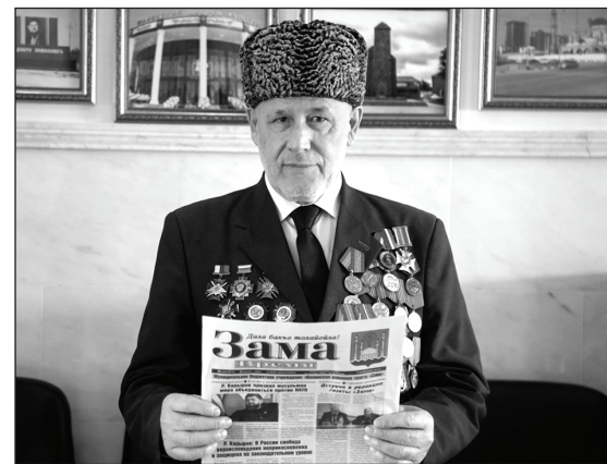
Редакция газеты «Зама».

Подписная цена на газету «Зама» на второе полугодие 2023 года составляет 400 рублей. Доставку гарантируем.