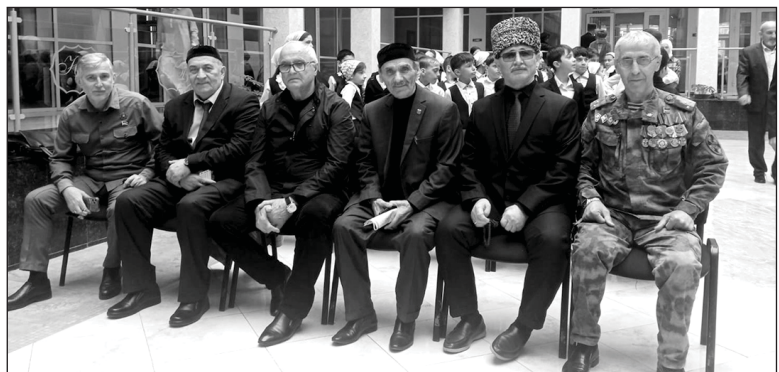
гергарчу наха а дакъалецира оцу цъаьнакхетарехь.